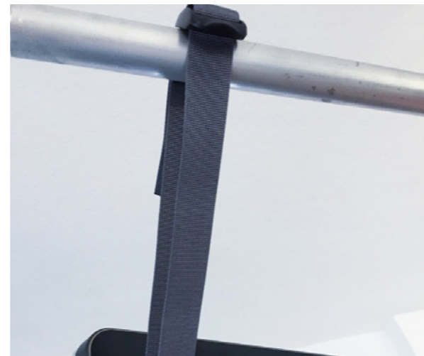
4. Set di ancoraggio