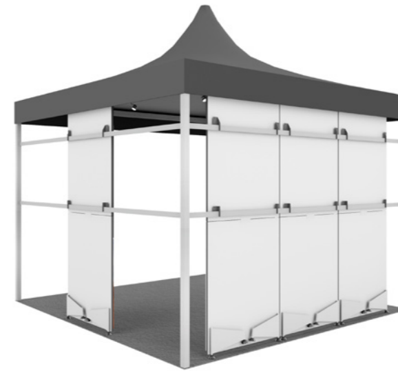
5. Supporto traversa per il fissaggio el gazebo

Tutte le soluzioni sono disponibili nello shop online del nostro sito web all'indirizzo (Codice QR): www.speedpepper.com