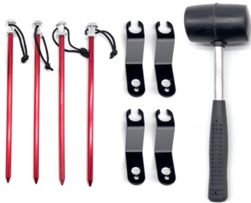
3. Set di ancoraggi al pavimento