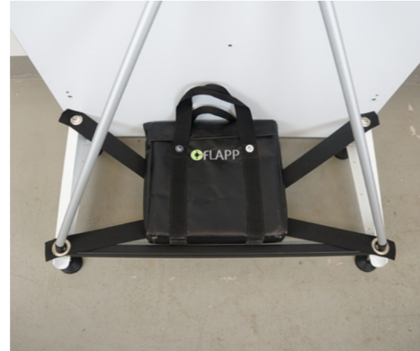
2. Set di piastre zavorra