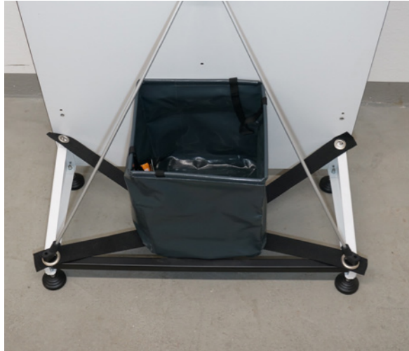
1. Set di sacchi riempibili

Per la stabilità all'esterno offriamo le soluzioni seguenti: